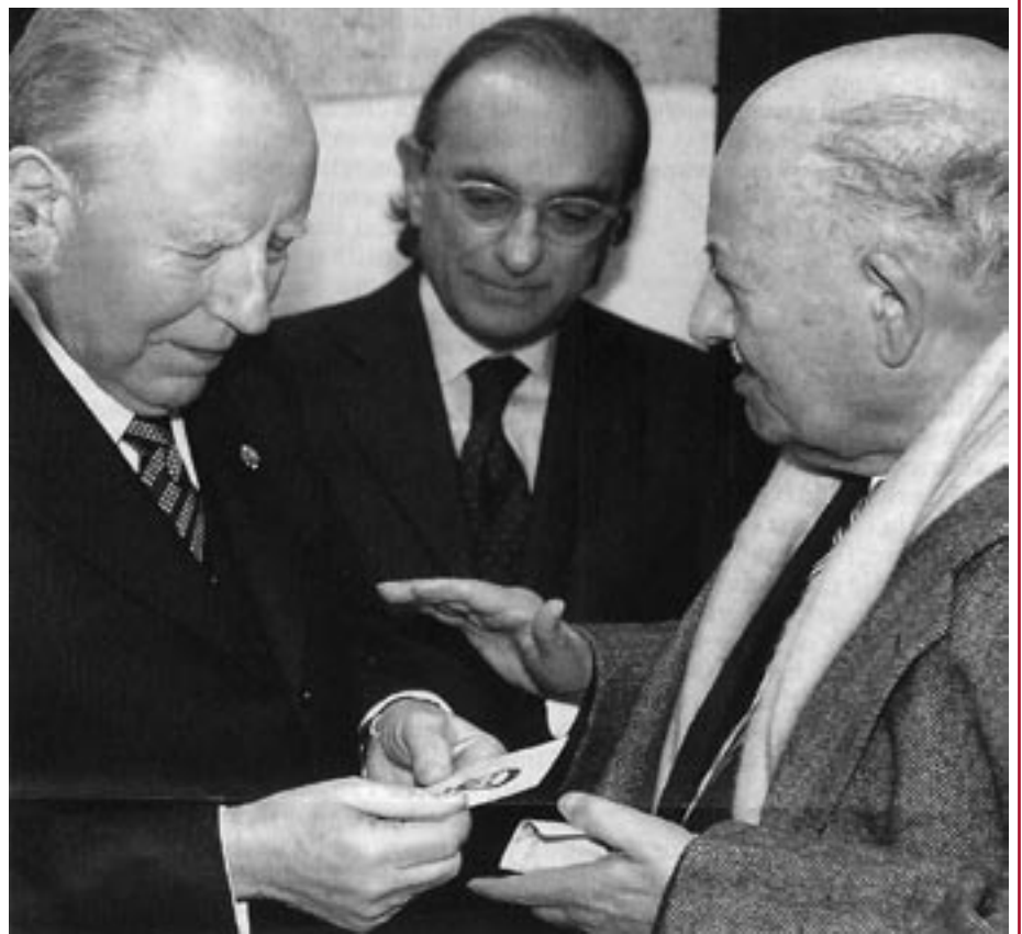
Il presidente Ciampi riceve dal padre di Rosario la foto del figlio assassinato dalla mafia

Un mandato - quello di decidere - attraverso il quale, scriverà Livatino in un'altra conferenza sul rapporto tra fede e diritto, «il magistrato credente può trovare un rapporto con Dio. Un rapporto diretto, perché il rendere giustizia è realizzazione di sé, è preghiera, è dedizione di sé a Dio. Un rapporto indiretto per il tramite dell'amore verso la persona giudicata. Il magistrato non credente sostituirà il riferimento al trascendente con quello al corpo sociale, con un diverso senso ma con uguale impegno spirituale. Entrambi, però, credente e non credente, devono, nel momento del decidere, dimettere ogni vanità e soprattutto ogni superbia; devono avvertire tutto il peso del potere affidato alle loro mani, peso tanto più grande perché il potere è esercitato in libertà e autonomia». Le due conferenze appena citate - che gettano luce su un lavoratore instancabile, dal-